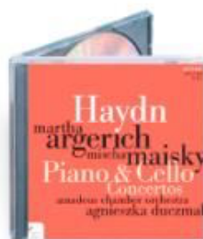
Martha Argerich, Mischa Maisky HAYDN NIFC, CD, 2018